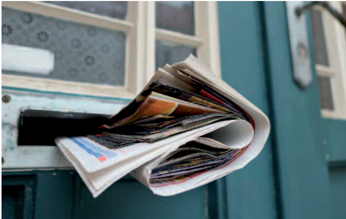
Das Ende der Massenkommunikation? AutLay schickt sich als automatisiertes Layoutprogramm an, Premedia zu revolutionieren.

zu revolutionieren. Dabei profitiert AutLay von der Forschungsarbeit der Uni Köln, wo sich Wirtschaftsinformatiker seit über einem Jahrzehnt mit Personalisierung und Individualisierung im Druck beschäftigen.