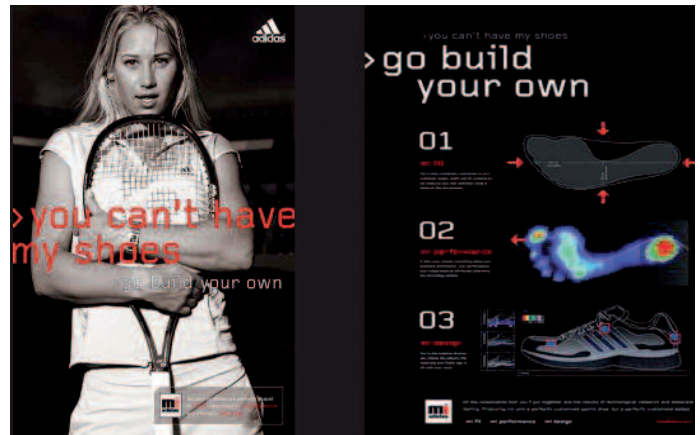
Hersteller von Sportschuhen reizen das Thema Mass Customization vom Kauf bis zum Neuerwerb perfekt aus.

Be- und Entladen, um Schneiderroboter, Pick and Place und sehr viel mehr.