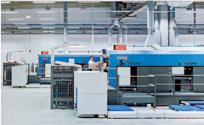
KBA Rapida 145. Im Vordergrund Teile der Papierlogistik.