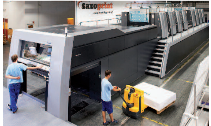
Die Speedmaster XL 145 und 162 werden auch bei Online-Printern eingesetzt.

Bequeme Auftragsvorbereitung und schnelle Auftragswechsel mit simultanen Rüstprozessen verkürzen die Rüstzeiten und erhöhen die Produktivität. Mit den Inline-Messungen und -Regelungen (wie Prinect Inpress Control 2 bei Heidelberg oder ErgoTronic ColorControl bei Koenig & Bauer) lassen sich auch anspruchsvollste Sujets mit vielen Sonderfarben sicher in höchster Qualität herstellen.