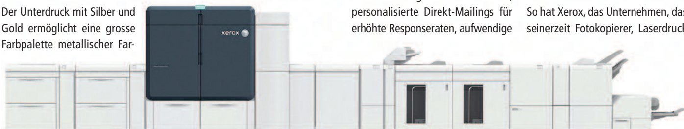
Für die Verarbeitung der Drucke (ganz gleich, ob 4- oder 6-Farben-Maschine) bietet Xerox eine Vielzahl an Finishing-Optionen an.

So hat Xerox, das Unternehmen, das seinerzeit Fotokopierer, Laserdruck