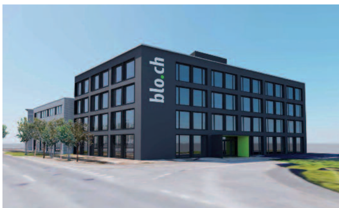
Blick auf den soeben bezugsfertigen Erweiterungsbau der Bloch-Gruppe.