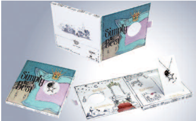
Beim Aufklappen der Karte vom Juwelier Binder entdeckt die Beschenkte dann nicht nur den besonderen Schmuckanhänger, sondern hört zugleich das Liebeslied, dessen Text auf dem Cover der Karte zu lesen ist.