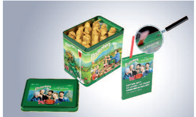
Einen kultigen Überraschungsmoment wollte die Traditionsmarke Underberg ihren Kunden beschenken. Gemeinsam mit Audio Logo entstand eine limitierte Schmuckbox mit Naturpanorama, die beim Öffnen den Sound des VoXX-Clubs abspielt.