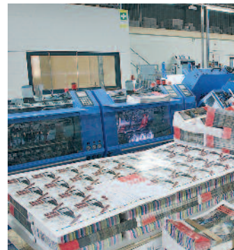
Dafür nimmt jedoch die Weiterverarbeitung deutlich mehr Raum in Anspruch.