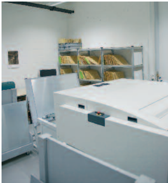
Das Kodak Magnus-CtP-Systemr ist auf 32 Platten/Stunde ausgelegt.