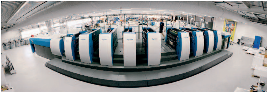
«Früher stand eine Druckerei voll mit Druckmaschinen, heute wird mit einer einzigen grossformatigen Rapida 106 produziert», stellt Bruno Jordi fest.