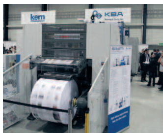
Anlässlich der Hunkeler Innovationdays im Februar 2013 druckte die KBA RotaJET jeden Morgen zuverlässig die «Luzerner Zeitung» mit den Original PDF-Daten in guter Qualität. Das rechte Foto zeigt links das im Offsetverfahren gedruckte Original und daneben die digital gedruckte Ausgabe.

KBA hat mit der gedruckten Zeitung 200 Jahre Erfahrung, viele Ideen für die Anforderungen von heute und morgen und geeignete Lösungen für die veränderte Medienwelt. Es ist also nicht verwunderlich, dass sich seit der Premiere der KBA RotaJET zur drupa 2012 erfolgreiche und chancenorientierte Zeitungsverlage und -druckereien zunehmend für die Digitaldruckrotation von KBA interessieren und sich oft begeistert mit den Möglichkeiten des kontaktlosen, platten- und einrichtefreien Druckens auseinandersetzen.