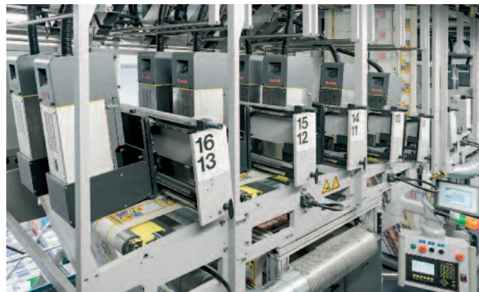
Kodak Prosper S10 Eindrucksysteme in den Inkjet-Towern einer Jet Web-Finishing-Linie.

Kyburz deckt dabei die ganze Wertschöpfungskette ab. Layout, Bildbearbeitung und Satz werden auf Kundenwunsch übernommen, Druckdatenaufbereitung und weitere Druckvorstufenfunktionen kommen dazu, das Management und die Programmierung von Adressdaten und weiteren variablen Datenbeständen, Rollenoffset, Bogenoffset und Digitaldruck, komplexes Inline-Finishing,