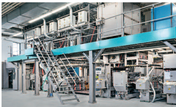
Teilsicht einer Jet Web-Finishing-Linie der Druckerei Kyburz AG mit zwei Inkjet-Towern auf der Galerie der Anlage.