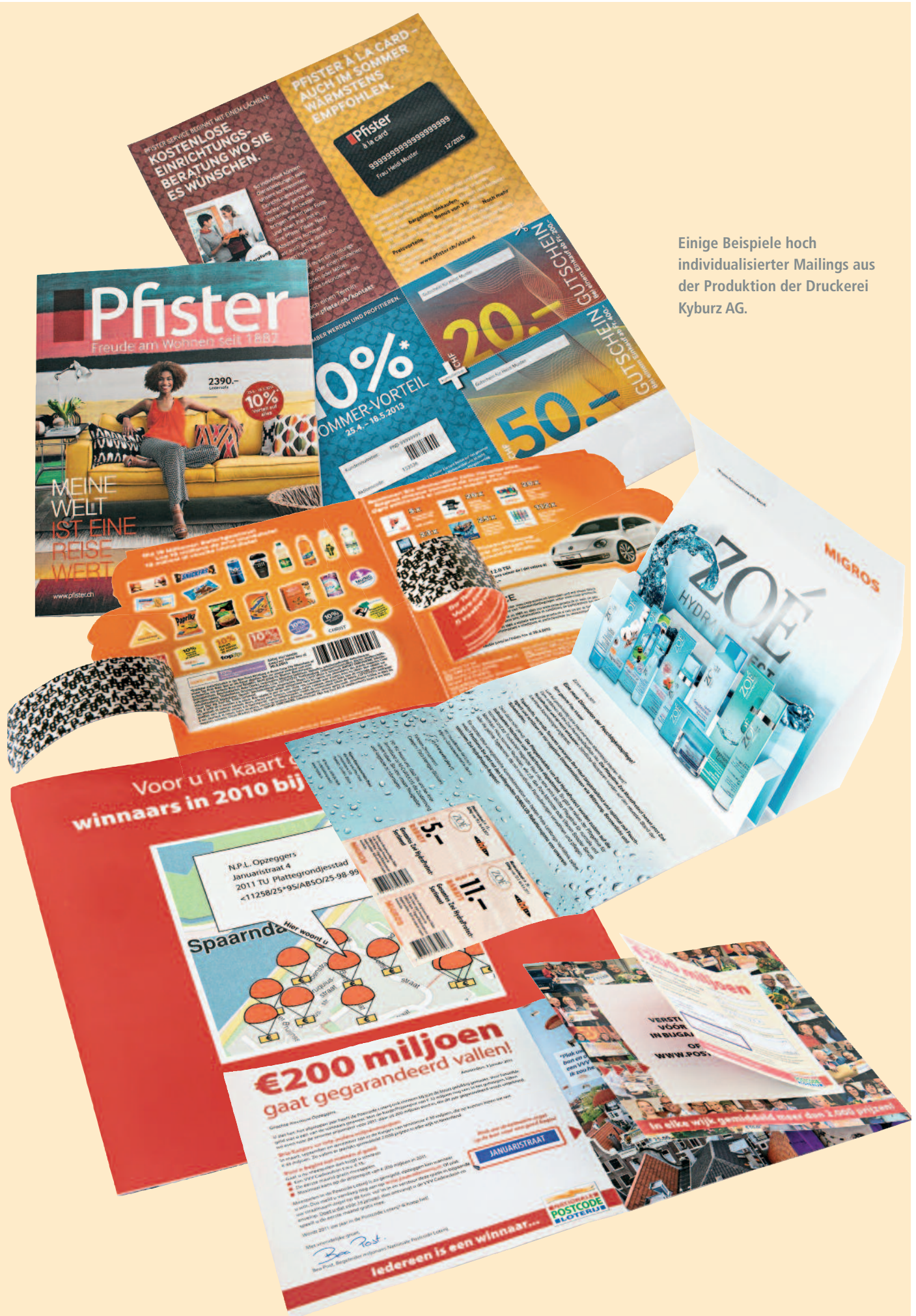
Einige Beispiele hoch individualisierter Mailings aus der Produktion der Druckerei Kyburz AG.