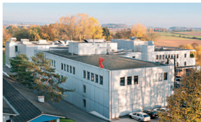
Das Betriebsgebäude der Druckerei Kyburz AG in Dielsdorf, etwa 15 km nordwestlich von Zürich.

In der am besten ausgebauten Finishing-Linie lässt sich die Papierbahn auf einer Breite von 900 mm vorder- und rückseitig in einer Farbe variabel bedrucken. Alternativ besteht in dieser Linie die Möglichkeit, bei einer anderen Bestückung und Positionierung der motorisch auf Traversen verfahrenen Eindrucksysteme auf beiden Seiten der Papierbahn je