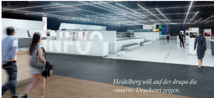
Heidelberg will auf der drupa die «smarte» Druckerei zeigen.

Die Heidelberger Druckmaschinen AG meldet für das dritte Geschäftsquartal ein positives Nachsteuerergebnis und nach neun Monaten (1. April bis 31. Dezember 2015) vor Steuern das Erreichen der Gewinnschwelle.