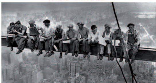
corbis IMAGE MATTERS

von Corbis. Der Verkauf umfasst die etwa 100 Millionen Bilder und die Filmarchiv von Corbis Images, Corbis Motion und Veer sowie alle damit verbundenen Marken und Warenzeichen. Die Bilder und Filme werden demnächst neben der bestehenden Getty Images Sammlung von nahezu 200 Millionen Bildern verfügbar sein.