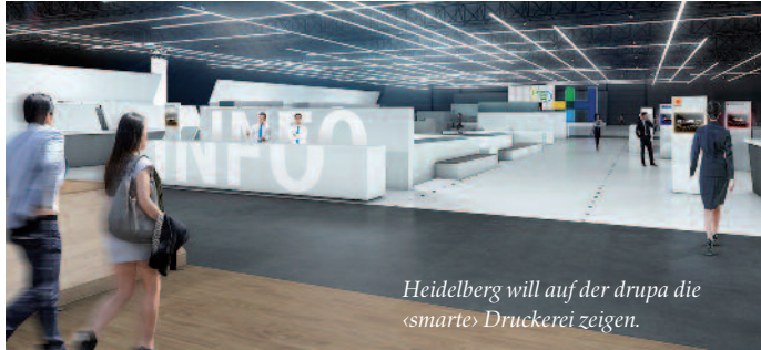
Heidelberg will auf der drupa die «smarte» Druckerei zeigen.

Die Heidelberger Druckmaschinen AG meldet für das dritte Geschäftsquartal ein positives Nachsteuerergebnis und nach neun Monaten (1. April bis 31. Dezember 2015) vor Steuern das Erreichen der Gewinnschwelle.