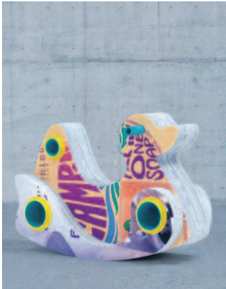
Umformen statt Wegwerfen. Flyerline verwertet gebrauchte Plakate in einem Upcycling-Prozess. Neben dieser Art von Möbeln bietet die Online-Druckerei auch Messestände in Leichtbauweise samt Mobiliar an.