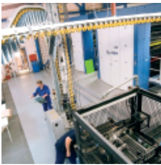
Im Hintergrund die beiden Cortina-Achtertürme bei Dijkman, im Vordergrund die entgegen der Papierlaufrichtung angeordnete Falzauslage.