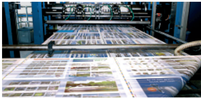
An der KBA Cortina bei Dijkman kann wegen der fehlenden Zonenschrauben und Feuchtwerke ohne großen Aufwand bei ganzbreiten Papierbahnen stufenlos zwischen 1.260 und 1.680 mm Bahnbreite variiert werden. Daraus ergibt sich die für einen Lohn-drucker wichtige große Formatflexibilität