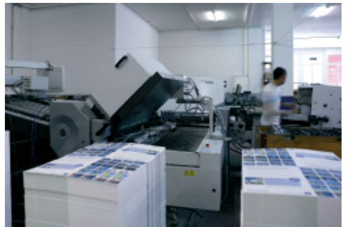
Zwei Polar Schneidstraßen und eine Schneidmaschine, zwei MBO-Falzmaschinen sowie ein Stahlfolder TH82.6/82.6-PFH82 und eine Stahl T 36/4 KB 36 sowie ein Sammelhefter mit 6 Stationen oder 5 Stationen und Umschlaganleger sorgen für die