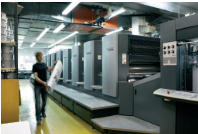
Im Drucksaal produzieren eine Speedmaster CD 102-6, eine SM 102-10-P6, eine SM 102-2-P und die SM 52-5 mit Anicolor-Farbwerk.