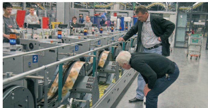
RollStream beim Chemnitzer Verlag und Druck: die Lösung für mehr Beilagen mit der Möglichkeit zu starker Regionalisierung.

am Markt ausgleichen. »Da muss man einfach schnell reagieren können. So haben wir noch während der Aufbauphase weitere Anleger nachgeordert.«