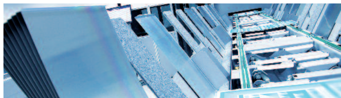
Es geht bei der Druckplattenherstellung nicht mehr nur um das Belichten, sondern immer mehr auch um die Druckplatten-Logistik. NELA bietet entsprechende Plate-on-Demand-Lösungen.

In diesem Zusammenhang wird deutlich, dass CtP mit umweltfreundlichen, prozess- und chemiefreien Druckplatten immer mehr zum Nor-