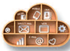
Basis für den Einladungsprozess zum Digitaldruck-Kongress, bei dem Webseiten programmiert, Landingpages bereitgestellt und verschiedene personali-

sierte Drucksachen produziert wurden, ist der Crossmedia Server von EFI DirectSmile. Dieser Server ist die ideale Plattform, um Kommunikationsmaßnahmen automatisch zu steuern und gleichzeitig mit attraktiven und individuellen Komponenten zu bereichern.