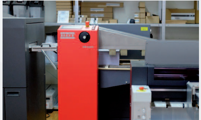
Mit dem Langformatanleger können auf der Nexpress ZX3300 Bogen bis zu einem Format von 356 x 1.000 mm bedruckt werden.