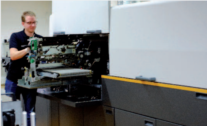
Die meisten Wartungsarbeiten können an der Nexpress vom Bediener selbst durchgeführt werden.