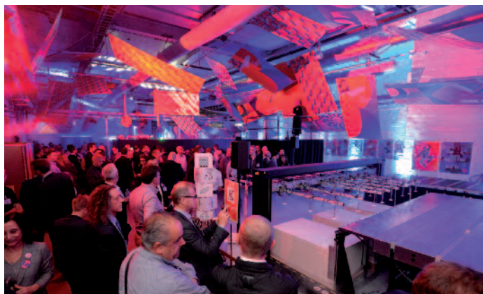
Anfang Juni rollte Agfa den roten Teppich für Sign & Display-Unternehmen aus aller Welt aus, um die neue Jeti Tauro H3300 LED vorzustellen. Über 300 Gäste