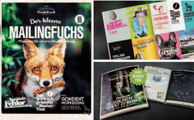
Unterhaltsam, lehrreich und praktisch: Das Mailingfuchs-Magazin und der Katalog bieten unterhaltsam verpacktes Fachwissen.