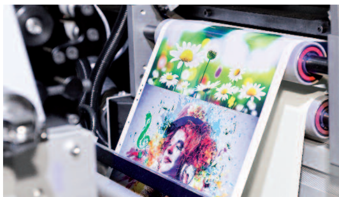
Kann deutlich mehr als Etiketten: Insignis nutzt die Gallus Labelfire auch für den Druck von Eintrittskarten oder Magazin-Cover.

Diese Funktionen wurden nun auf den rotativen Siebdruck ausgedehnt. Das integrierte Siebdruckwerk kann im Up- oder Downstream der Maschine positioniert werden. Vor der digitalen Druckeinheit lässt sich zum Beispiel die unschlagbare Opazität des Weiß im Siebdruck nutzen. Nachgelagert kann die ganze Palette der Veredelungen des rotativen Siebdrucks zur Geltung kommen, wie etwa die haptischen Effekte bei