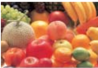
RGB-Daten wurden in ISOcoated.icc konvertiert und im Offsetdruck gedruckt: Ein optimales Druckergebnis.