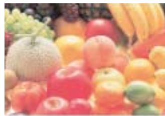
RGB-Daten in Zeitung.icc konvertiert und im Bogenoffsetdruck gedruckt: Das Ergebnis ist viel zu hell und kontrastarm.

bereits bei der Aufbereitung der Daten zum Druck erfolgen.