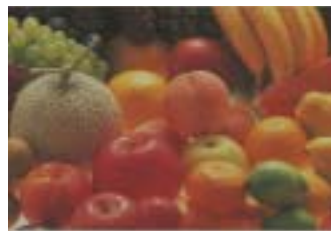
RGB-Daten wurden in ISOcoated.icc konvertiert und im Zeitungsdruck gedruckt: Das Bild ist »abgesoffen« und viel zu dunkel.