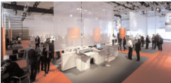
Canon legte bei seiner Veranstaltung in den Düsseldorfer Rheinterrassen den Fokus auf Workflowszenarien und Anwendungen mit Softwarelösungen sowie einer neuen Generation von Digitaldrucksystemen.