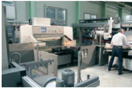
Von der Insellösung über Schneidstraße zum Schneide-Roboter: den technischen Möglichkeiten sind auch im Bereich Schneiden scheinbar keine Grenzen gesetzt.

netzung mit dem Prinect PostPress Manager angekündigt. Polar-Schneidemaschinen lassen sich bereits seit längerem über Computercut voreinstellen. Dabei handelt es sich um eine separate Konsole mit Offline-Verbindung zur Schneidemaschine.