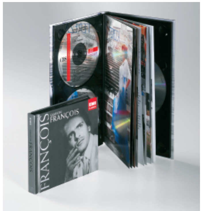
Der Markt der Bücher verändert sich ebenso rasant wie die Form und Ausprägung des Buches. In der Abbildung ein auf dem VBF-Hardcover-System hergestelltes CD-Buch.

Neben den Niedrigpreis-Büchern spielen immer mehr Nischenprodukte und Kleinauflagen eine Rolle im Alltag der Buchbinder. Die Preise, die den Buchbindern für Großauflagen bezahlt werden, sinken. Weitaus besser können sie durch Sonderformen und Kleinauflagen verdienen. Bei den Sonderformen sind aufwändig verarbeitete Bücher ebenso zu