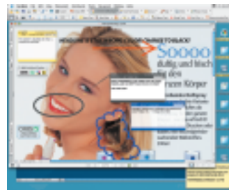
Beim Softproof sind Kommunikationsmöglichkeiten gegeben, die den Abstimmungsprozess erleichtern.

kalibriertes Profigerät. »Wir haben hier Hard- und Softproof miteinander verheiratet. Schließlich sind es zwei Welten – RGB und CMYK – die in diesem Hybrid-Proofing zusammenfinden,« so Kämmerer.