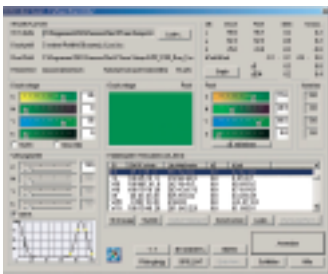
Menü zur Durchführung von Farbkorrekturen im CMYK-Farbraum.