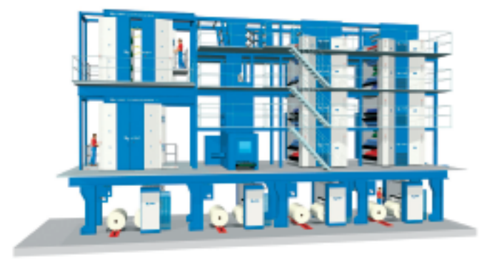
standsvorsitzender KBA) und Bernhard Harant (Spartenleiter KBA). So wird die KBA Commander-Anlage bei der Main-Post nach der Erweiterung im Jahr 2008 aussehen. Links die beiden zu einem 16er-Turm für 32 vierfarbige Broadsheet-Seiten aufeinander gesetzten kompakten