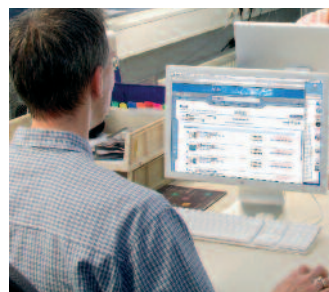
Über den Webbrowser lässt sich auch der Kunde in den Produktionsprozess einbinden: Er kann seine Aufträge überprüfen und für die weitere Produktion freigeben oder Änderungswünsche übermitteln. Im Bild das Kodak-Portal Insite.

werden an den zwei Druckstandorten in Kanada und Holland täglich abgewickelt. Die im Sekundentakt eingehenden Druckjobs werden im Rechenzentrum auf den Bermudas verarbeitet und innerhalb von Minuten zu Sammelformen aufgefüllt. Auf einer Druckplatte finden so entweder 142 Visitenkarten, 52 Postkarten oder 9 Briefbögen Platz. Vom Ausschleßen über den Druck bis zum Versand und Fakturierung ist alles im höchsten Maße automatisiert. Der Preisdruck, der von den Online-Printshops und deren Druckfabriken ausgeht, wird auch die kleineren Druckbetriebe zur Automatisierung ihrer Workflows zwingen.