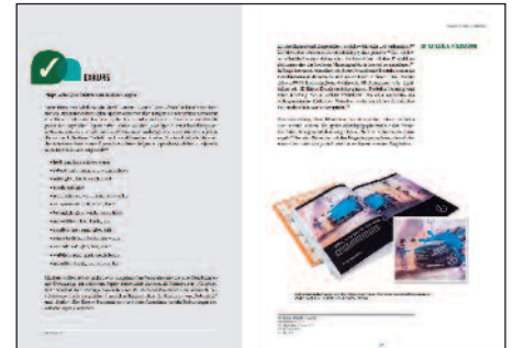
Print und Printveredelung nehmen Menschen auf sinnliche Erlebnisreisen mit, die messbar auf die Markenerinnerung, das Markenvertrauen, den Response und die Kaufbereitschaft sind.