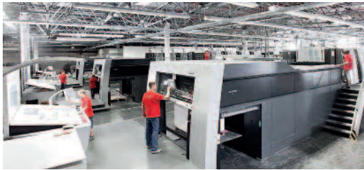
Druckproduktion bei Saxoprint in Dresden.

Rund zwei Jahre nach der Übernahme der Berliner Druckerei Laserline durch die Cewe-Gruppe verlagert der Fotodienstleister die Druckproduktion von Berlin nach Dresden zu Saxoprint . Ab Mitte 2020 sollen in der sächsischen Landeshauptstadt grosse Teile der Aufträge von Laserline produziert wer-