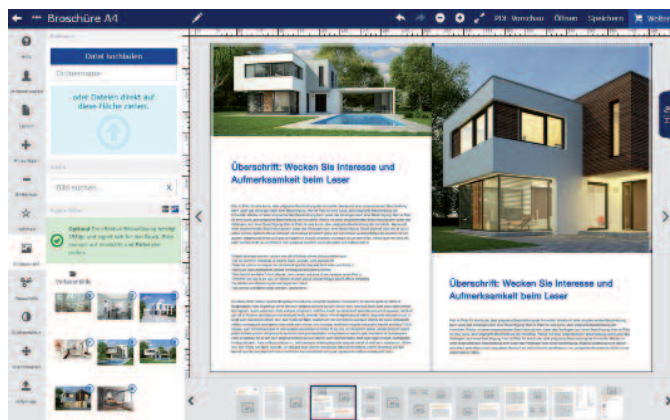
Die Bacher Immarketing -Portale bieten Maklern vielfältige Möglichkeiten der Gestaltung der einzelnen Seiten ihrer Exposés mit Bildern.

Über ihre Exposés hinaus generieren die Nutzer auf den Portalen auch ihre Anzeigen und Profilbilder, die sie in Tageszeitungen