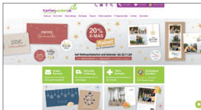
Über die B2B-Shops für Makler hinaus nutzt Bacher PrePress den Designer Pro von Obility auch in seinem offenen Online-Shop www.kartenmacher.ch für Grusskarten.

und auf Immobilienportalen veröffentlicht. Diese Dokumente werden in Form von PDF-Dateien heruntergeladen, können aber auch gedruckt werden. Die Portale sind also durchgängig auf eine crossmediale Verwendung aller Dokumente ausgerichtet.