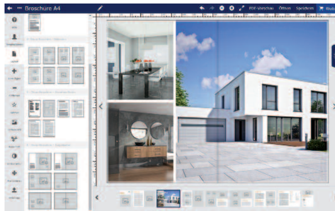
Beim Layout jeder einzelnen Seite haben die Makler dank des Web-to-Print-Editors Designer Pro von Obility die Wahl zwischen mehreren verschiedenen Varianten.