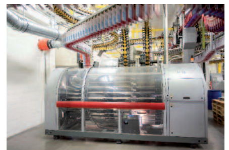
Bei der Somedia Partner AG machen die Hefttrommel StreamStitch und die Schneidtrommel SNT nun auch eine Produktion von Coldset-Produkten bei der vollen Geschwindigkeit von 36.000 Takten pro Stunde mit separatem Umschlag oder aus unterschiedlichen Substraten möglich.