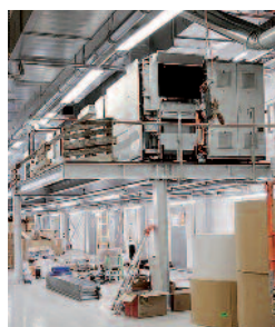
Auf 800 m 2 Produktionsfläche wird die neue Anlage gebaut. Dazu werden bis zu 7 Tonnen schwere Anlageteile in der Produktionshalle positioniert.

Konzipiert und gebaut wird die Anlage, um im Hauptmarkt der Druckerei Kyburz AG , der Herstellung von Selfmailern, Mailings, Losen und Briefen, schneller und variabler zu werden. Wie bei allen Anlagen der Druckerei Kyburz AG steht eine Philosophie im Vordergrund: «Wir produzieren Werbung, die sich abhebt». Für die Druckerei Kyburz war immer klar, dass nicht in eine Anlage ab Stange