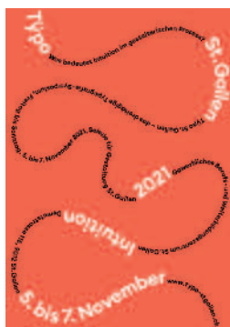
Die Typo St. Gallen wird 2021 bereits zum sechsten Mal veranstaltet und lädt die Besucher vom 5. bis 7. November 2021 ans GBS nach St. Gallen ein.

Sei es im Privat- oder Berufsleben: Projekte und Vorhaben werden oft spontan zugesagt. Gelingen sie, spricht man vom Bauchgefühl, auf das man sich verlassen konnte. Umgekehrt kann ein ungutes Gefühl vor Enttäuschungen schützen. So weit die Theorie der «Intuition», mit der sich die rund 20 hochkarätigen Redner an der diesjährigen Typo St. Gallen beschäftigen. Das dreitägige Typografie-Symposium