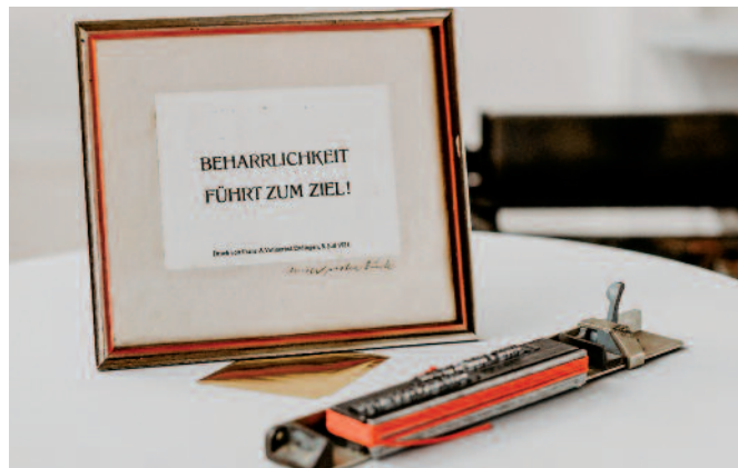
Der Leitsatz «Beharrlichkeit führt zum Ziel» wird bei Vollherbst seit Generationen gelebt.