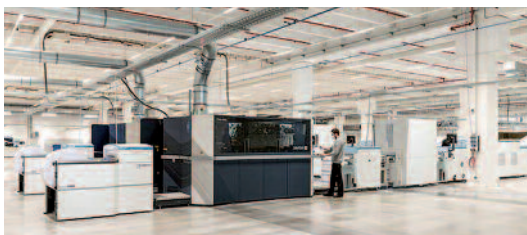
Blick in die Produktion von BoD.

Die Prinovis GmbH sieht sich offenbar gezwungen, den Geschäftsbetrieb der Druckerei in Dresden zum 31. Dezember 2022 einzustellen. Wie Prinovis erklärt, schreibt der Standort seit geraumer Zeit rote Zahlen. Hintergrund sei die Tatsache, dass der europäische Tiefdruckmarkt schon seit mehr als einem Jahrzehnt strukturell rückläufig ist. Im Zeitraum 2010 bis 2020 habe sich beispielsweise der Bedarf an klassischen Tiefdruckpapieren um weit mehr als die Hälfte reduziert.