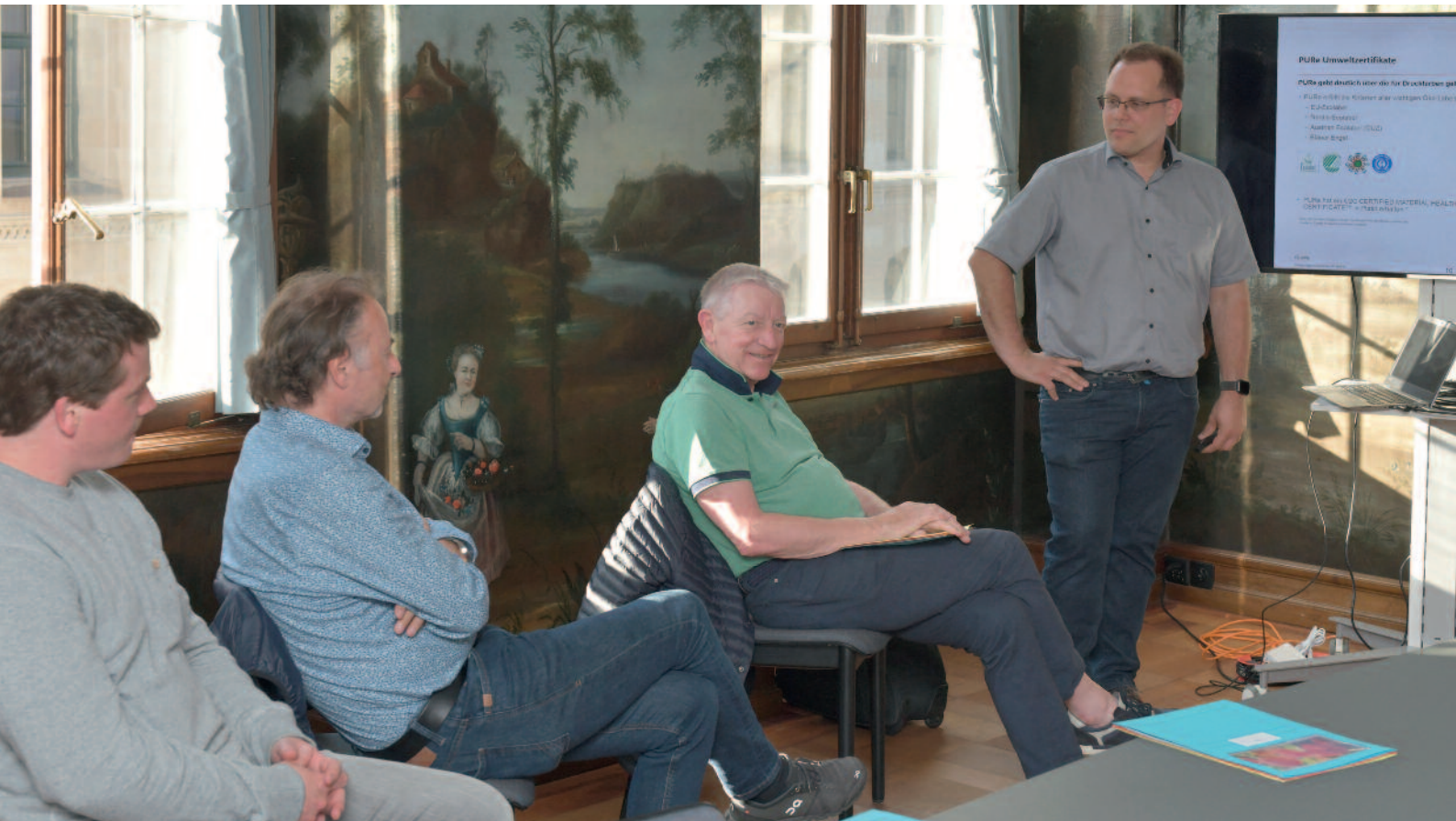
Spannendes Expertenwissen zur PURE-Welt.