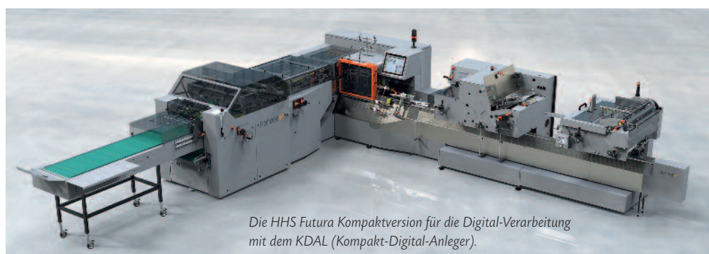
Die HHS Futura Kompaktversion für die Digital-Verarbeitung mit dem KDAL (Kompakt-Digital-Anleger) .

Zudem verarbeitet die HHS Futura Rollenware aus Digitaldruckmaschinen. Hierfür werden ein Abwickler UW23 , ein Querschneider SVCS25C und ein digitales