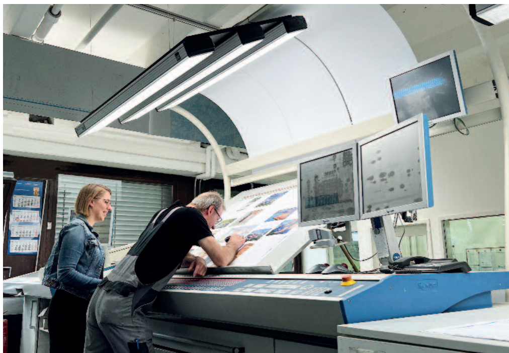
Abmusterung an der Offsetdruckmaschine mit der Just DLS-Retrofit-Lösung. Anwender, die eine Farbprüfstation eines Drittanbieters besitzen, können mit dem Just DLS Retrofit System ihre bestehende Farbprüfstationen umrüsten und profitieren somit von allen Vorteilen des Digital Light Systems, ohne eine komplette Neuanschaffung.

Wer auf die Verwendung qualitativ hochwertiger Beleuchtung in der Farbabmusterung angewiesen ist, kann auf alternative LED-basierte Lösungen umstellen.