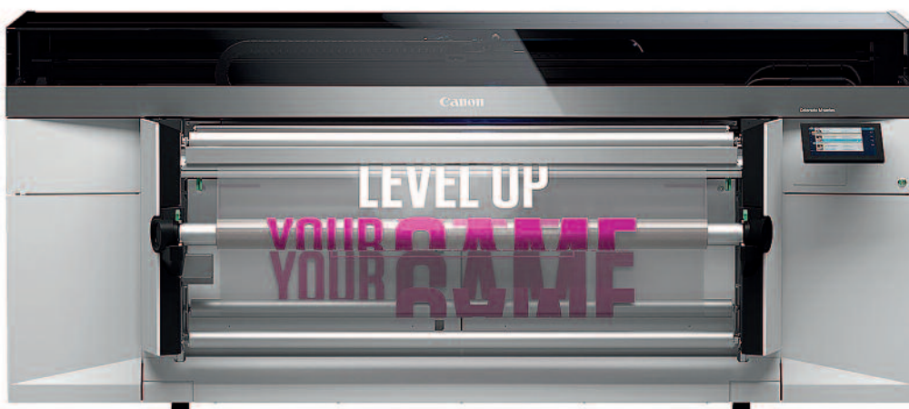
Aufgrund der Möglichkeit des Upgrades bei der Geschwindigkeit und der Option der zusätzlichen weissen Farbe gibt es von der Colorado M-Serie vier Varianten.

ein- oder zweistufiges Härtingsverfahren nochmals, womit samtig-matte oder glänzende Oberflächen sowie matt-glänzende Anwendungen möglich sind.