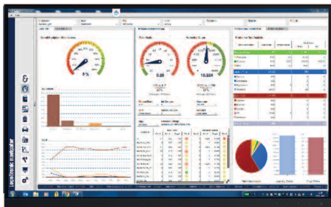
Mit dem LogoTronic Cockpit haben die Druckfachleute von Jordi AG wichtige Leistungskennzahlen in Echtzeit im Blick.

jeden Bogen misst, sowie der Einsatz von QualiTronic PDFCheck (PDF-Vergleich mit anschliessender Druckbildkontrolle bei laufender Produktion) ermöglicht signifikante Qualitätssteigerungen, das frühzeitige Erkennen von Fehlern und eine deutliche Makulaturreduzierung. Gleichzeitig werden die Drucker durch den automatischen PDF-Abgleich bei der Qualitätskontrolle entlastet.