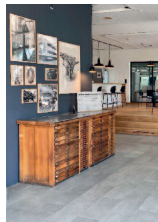
In der neu umgebauten Eingangshalle der Jordi AG sieht man wertvolle Zeitzeugen der Jordi AG.

«Druck lebt! Und was lebt, verändert sich. So haben wir uns über die Jahre von der klassischen Druckerei zum innovativen Dienstleister entwickelt und am Markt etabliert. Seit fast 130