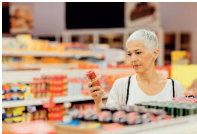
Verbraucher werden durch eine vorschnelle Vorverurteilung durch nicht repräsentative Studien verunsichert und kommen bei der Beurteilung der Klimawirkung von Verpackungen zu völlig falschen Einschätzungen.

So konnten beispielsweise seit 1991 alleine durch leichtere Verpackungen mehr als 23 Millionen Tonnen Material eingespart werden. Dass es trotzdem bis 2021 einen stetigen Zuwachs an Verpackungen gab, liegt vor allem am steigenden Konsum und der steigenden Zahl verkaufter Produkte.