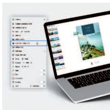
Über 3 Millionen kostenfreie Fotos.