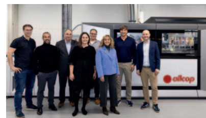
Eine Canon varioPrint iX2100 erweitert und optimiert die Produktivität bei der allcop Farbbild-Service GmbH & Co. KG in Lindenberg.

Die Inbetriebnahme der Inkjet-Produktionslösung stärkt nicht nur die technologische Basis des Fotodienstleisters, sondern unterstreicht auch den Anspruch Canons , die digitale Transformation im industriellen Druck aktiv mitzugestalten.