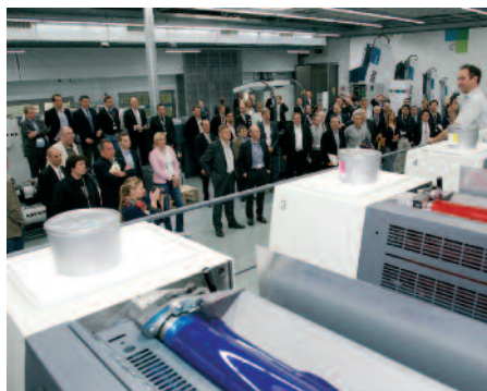
Spannendes über neue Maschinen, Technologien und Anwendungen gab es sowohl in Offenbach