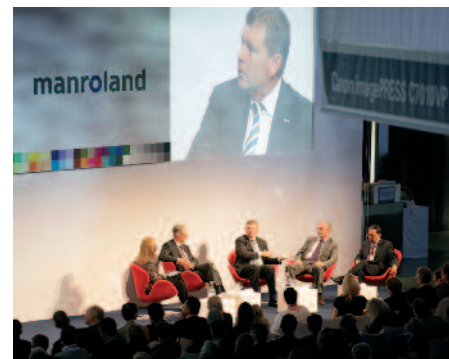
auch die Kooperation von Océ und manroland noch einmal bekräftigt wurde.

Das klingt zunächst wenig ambitioniert. Doch der Vorstandsvorsitzende von manroland weiss natürlich aufgrund seiner Erfahrungen, dass sich Projektgeschäfte nicht aus dem Hut zaubern lassen. Das sei auch der Unterschied zum Wettbewerber aus Heidelberg, der sich mit deutlich kleineren Modellen im Digitaldruck bewegt. «Wir zeigen jedoch auf, wie Inkjetdrucksysteme den industriellen Offsetdruck ergänzen», erklärte