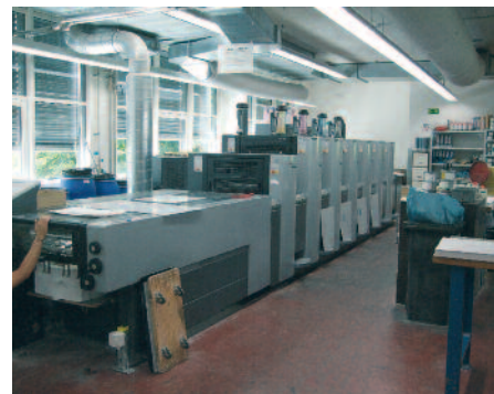
In Sichtweite der HP Indigo 5500 produziert bei Multicolor die Heidelberg Anicolor.

Zudem sei die Logistik beim Offset- und Digitaldruck völlig unterschiedlich, weshalb eine Harmonisierung anzustreben sei. «Ebenso wie eine HP Indigo in einem grösseren Format», fordert Lehmann.