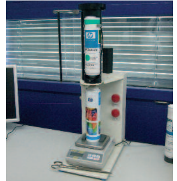
Sonderfarben für die HP Indigo, die selbst gemischt werden, sind in Kloten tägliches Handwerk.

schinen im Format 50 x 70 cm mit fünf beziehungsweise vier Druckwerken sowie eine A3-Maschine.