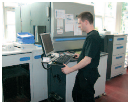
entstanden sind. Besonders angetan ist er von der Option »Deckweiss«.