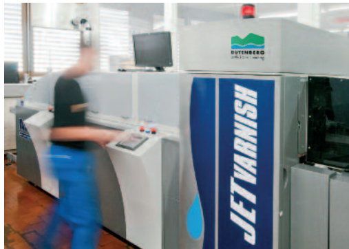
Veredelung eines Printprodukts in erster Güte: die JET-varnish bei der Gutenberg Druck AG.

Die integrierte UV-Trocknung ermöglicht eine sofortige ozon- und lösungsmittelfreie Aushärtung des Lackes. Dabei sei der Energieverbrauch wesentlich geringer als bei herkömmlichen UV-Lackiersystemen, teilt das Unternehmen mit.