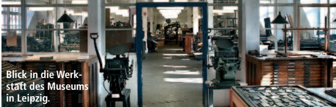
Blick in die Werkstatt des Museums in Leipzig.

Auf Einladung der Messe Düsseldorf zeigt das Museum für Druckkunst Leipzig auf der drupa einen Querschnitt seiner einzigartigen Sammlung. Drucksachen nehmen in einer zunehmend digitalen Welt eine wichtige Stellung ein. Ihr klarer Vorteil: Sie können mit allen Sinnen erlebt werden. Daran anknüpfend setzt das Museum in seiner Präsentation auf Sinneseindrücke wie Sehen, Riechen und Anfassen. Damit will das Museum eine Brücke zwischen Historie und Moderne in der Druckindustrie schlagen. Das Museum präsentiert auf rund 300 m 2 historische Druckmaschinen, Pressen, Geräte und exklusive Produkte aus dem Museumsshop. Gedruckt wird täglich live in Halle 6.