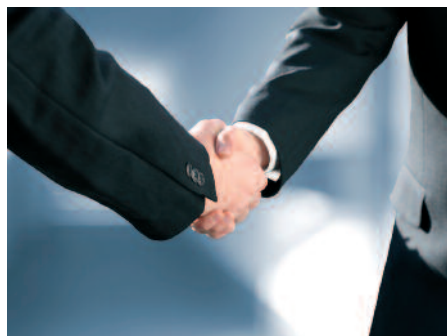
Führen Sie einen positiven Abschluss bewusst und gezielt herbei.

Der Trainingsinhalt richtet sich nach der Maxime: Praxisbezug, Umsetzbarkeit, Einfachheit und absolute Verständlichkeit. 2 x 1 Trainingstag mit Umsetzungs-Aufgaben und Zielen für den 2. Trainingstag.