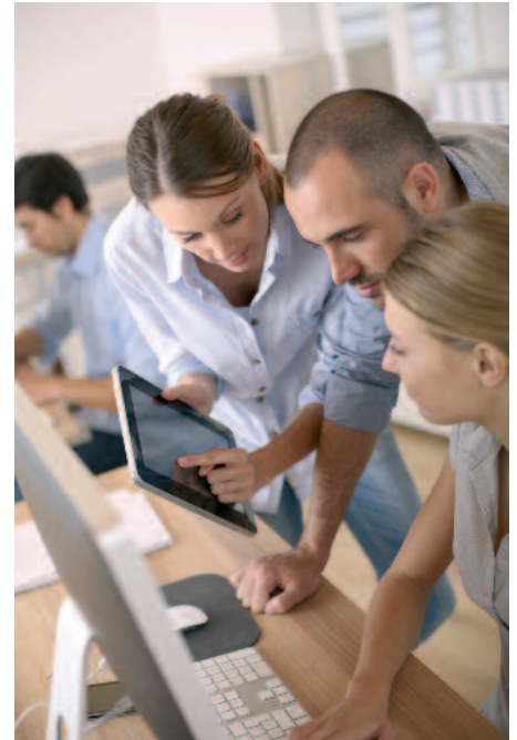
Motivierte, kompetente Mitarbeiter – lernen Sie, wie Sie Kunden überzeugen.

Verkaufskompetenz ist nicht Talent, sondern zum grössten Teil Fleiss und regelmässiges Training. Die Tatsache, dass es hinsichtlich Neukundenakquisition enorm schwierig geworden ist, Erfolge kurzfristig einzufahren, gibt der Entwicklung der