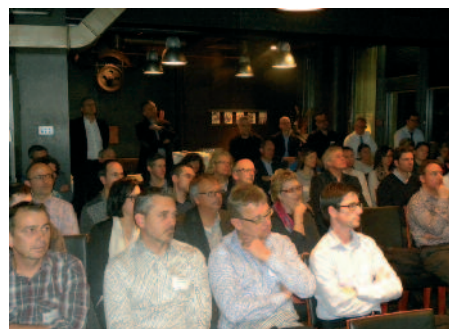
Interessierte Teilnehmer/-innen am Event in Zürich.

Agile Prozesse sind in anderen Branchen schon lange etabliert und erprobt. Es wird Zeit, dass wir von diesen Erfahrungen profitieren und sie auf das Publishing adaptieren: So gibt es in agilen Prozessen kein Lastenheft mehr. Stattdessen be-