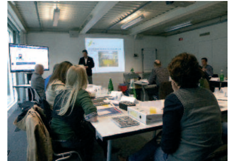
Erster Kurstag des CAS bei Goldbachmedia in Küssnacht.

Wer im Zeitalter der crossmedialen Kommunikation mithalten will, der braucht ein neues (Marken-)Denken und Erfahrung in der digitalen Produktion. Egal, ob individuelle Kampagnen umzusetzen oder automatisierte Werbemittel zu produzieren sind, das Anforderungsprofil hat sich geändert. Das Management einer Kampagne, in der mehrere Medien zum Einsatz kommen, erfordert spezielles Know-how. Hier braucht es die Fach-