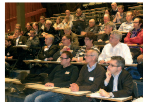
Die Aula in der Schule für Gestaltung in Bern war gut besucht.

Danach beginnt ein neuer Sprint mit den nächsten User Stories. Jeder Sprint führt näher zur Vision. Die User Stories werden dabei laufend erweitert und angepasst. Und innerhalb des Sprints? Da wird komplett anders gearbeitet als bisher: Alle Fachdisziplinen arbeiten gleichzeitig an der Erfüllung der User Stories. So entstehen ein intensiver Austausch zwischen den Disziplinen und eine unmittelbare, offene Form der Kommunikation. Innovative Vorhaben zeichnen sich durch einen