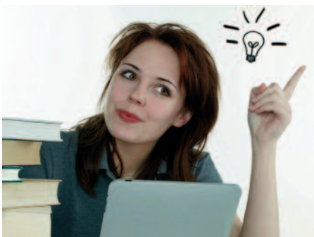
Zeigen Sie Ihrem (potenziellen) Kunden Chancen und Nutzen auf.

chen, müssen sowohl emotionale als auch rationale Impulse stark und stimmig sein. Die Wirkung der Botschaft muss überzeugen, und dazu müssen auch die richtigen Präsentationsmethoden eingesetzt werden. Diese Fertigkeiten vermitteln und trainieren wir an diesem Kurs anhand praktischer Beispiele. Durch mentale Stärke können wir die positive Denkweise bei den Leuten in der Technik fördern. Die ist ein wichtiger Aspekt, um dem Kunden anspruchsvolle Lösungen gewinnbringend zu verkaufen.