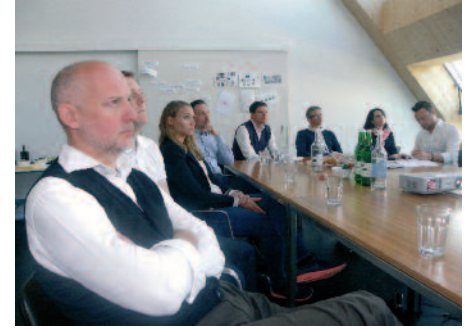
Ein spezieller Event auch für Integrierte von Publishing-Lösungen.

hohen Neuigkeitsgrad und offene Zielvorstellungen aus. Diese Komplexität lässt sich kaum noch mit der klassischen Problemlösungs-Schrittfolge bearbeiten – vielmehr eignet sich dafür ein lernendes und aktives Vorgehen. Im IT-Bereich und der Software-Entwicklung werden nutzerfokussierte und agile Lösungen seit Jahren erfolgreich eingesetzt. Es stellt sich nun die Frage, wie sich dieser Ansatz auf das Publishing übertragen lässt. Agiles Publishing ist aus Sicht des Fachverbandes publishingNETWORK ein idealer Ansatz für eine schnelle Anpassungsfähigkeit der Prozesse auf neue Gegebenheiten und hat die Eigenschaft, Flexibilität, Schnelligkeit und Schlankheit im Betrieb zu fördern. Flink und beweglich funktionierte schon früher, um ein Problem im Team zu lösen. Ein agiles Vorgehen in Crossmedia-Projekten ist sehr hilfreich, aber: welche Prinzipien und Methoden können übertragen werden – und welche gilt es entsprechend anzupassen? Erfahrungen zeigen jedenfalls: es gibt erfolgreiche Ansätze, agil geht nicht nur, sondern ist sogar ausgesprochen effektiv in komplexen Projektsituationen!