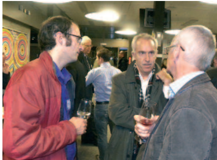
Das Thema hat Potenzial für Veränderungen.