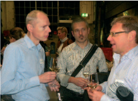
Netzwerken am Apéro – ein wichtiger Aspekt.