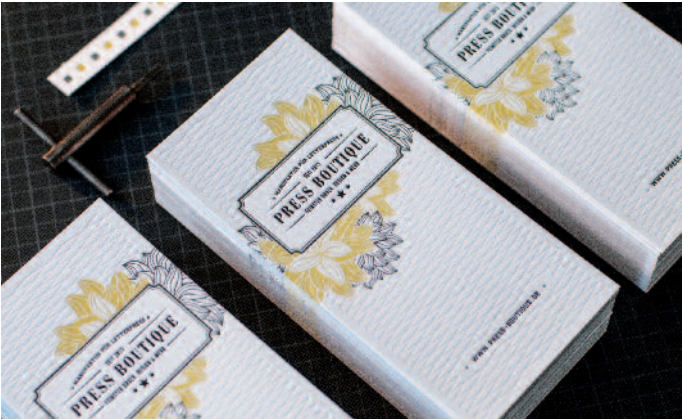
Ausschliesslich auf antiken Druckriegeln werden in der Press Boutique Drucksachen in kleinen und mittleren Auflagen gefertigt.