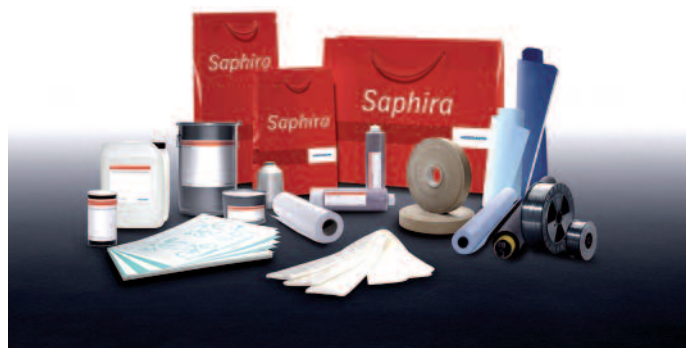
Das Angebot an Verbrauchsmaterialien der Marke Saphira ist umfassend. Im Sortiment finden sich aufeinander abgestimmte, auf Qualität und Leistung getestete Produkte.

Die Nachfrage nach entsprechenden Materialien wachse kontinuierlich.